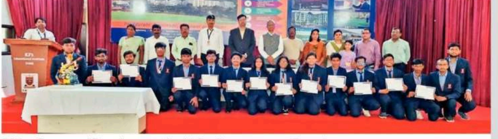
ट्रिनिटी महाविद्यालयात आयोजित कार्यक्रमात सहभागी झालेले विद्यार्थी, पालक, प्राध्यापक आणि प्राचार्य.

के. जे. संस्थेच्या ट्रिनिटी अभियांत्रिकी आणि संशोधन महाविद्यालयामध्ये शिक्षक-पालक मेळावा पार पडला. त्यावेळी ते बोलत होते. या मेळाव्यासाठी वेगवेगळ्या