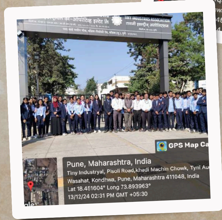
Visit to M/s Kitchen Concept Private Limited on 13th December 2024